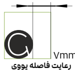
رعایت فاصله یووی