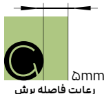
رعایت فاصله برش