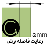
رعایت فاصله برش