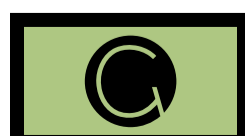
عدم استفاده از کادر