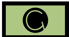
عدم استفاده از کادر